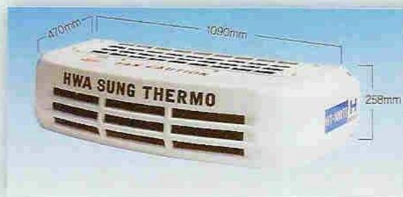
Waga ~ 25kg Skraplacz czołowy