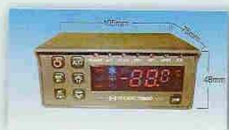
Sterownik montowany w kabinie kierowcy

Ultra płaski parownik sufitowy zapewniający maksymalne wykorzystanie ładowni. Wysoka wydajność wentylatorów gwarantuje szybkie schłodzenie izotermy.