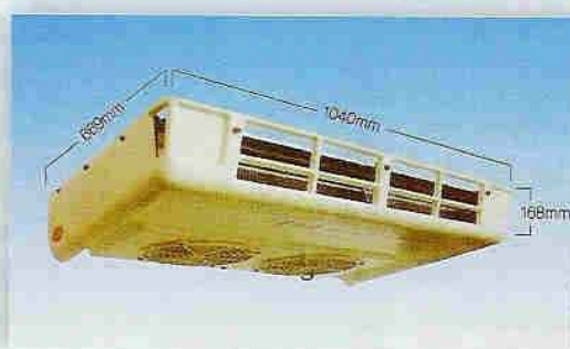
Waga ~ 24kg

Ultra płaski parownik sufitowy zapewniający maksymalne wykorzystanie ładowni. Wysoka wydajność wentylatorów gwarantuje szybkie schłodzenie izotermy.